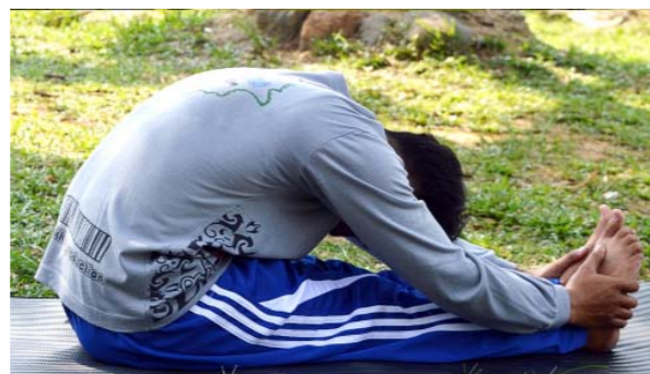
Gambar 4.12. Gerakan Yoga Paschimottanasana (Sumber gambar: www.kampoengilmu.com )

Langkah melakukan gerakan yoga Paschimottanasana adalah dengan