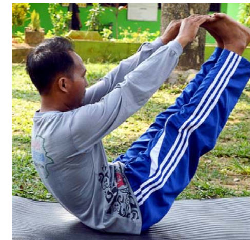
Gambar 4.13. Gerakan Yoga Navasana

Gerakan Yoga Navasana ini berguna untuk mengecilkan perut buncit dan juga menguatkan otot perut dan punggung. Gerakan yoga Navasana membutuhkan keseimbangan tubuh dan konsentrasi. Sehingga pikiran kita akan lebih fokus dengan melakukan gerakan yoga tersebut.