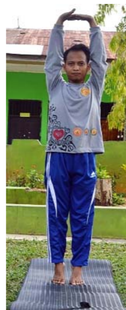
Gambar 4.1 : Gerakan Yoga Tadasana

Gerakan yoga Tadasana dapat dilakukan dengan mudah yaitu dengan berdiri tegak kemudian jinjitkan kaki, angkat tanganmu ke arah atas bersamaan menarik napas. Setelah 5 detik baru tapakkan kedua kaki pada matras sambil membuang napas. Lakukan gerakan yoga Tadasana ini sebanyak 5 sampai 10 kali berulang-ulang.