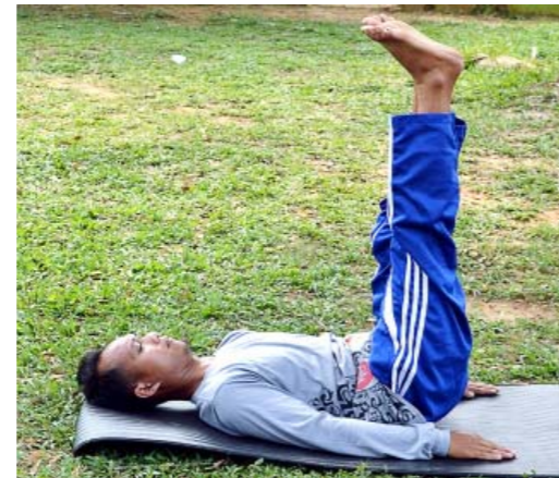
Gambar 4.7 Gerakan Yoga Uttanpadasana

Gerakan yoga Uttanpadasana ini juga dapat membuat Anda mengatasi perut buncit berlemak dan berat badan berlebih. Perut buncit sering menjadi masalah bagi banyak orang. Untuk mendapatkan perut rata dan tidak buncit lagi Anda dapat mencoba melakukan gerakan yoga Uttanpadasana.