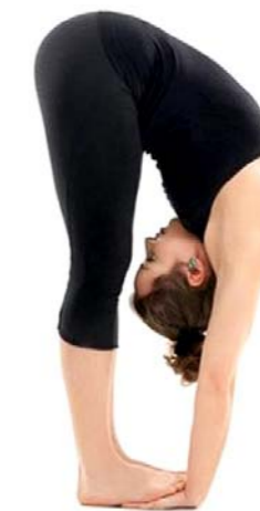
Gambar 4.5. Gerakan Yoga Padahastasana

Cara melakukan gerakan yoga Padahastasana adalah berdiri tegak, kemudian angkat kedua tangan ke arah atas sambil menarik napas. Lalu tarik dan letakkan tangan di bawah telapak kaki sambil menghembuskan napas. Gerakan yoga Padahastasana ini dilakukan selama satu menit. Jika belum terbiasa jangan terlalu memaksakan diri untuk melakukan pose yang sempurna sampai wajah benar-benar menghadap lutut. Lakukan gerakan yoga Padahastasana ini 10-12 kali.