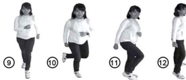
Gambar 4.13 Gerak langkah sajojo pertama

4. Langkahkan kaki kanan ke depan, lalu langkahkan ke belakang disertai ayunan tangan ke depan secara bergantian antara tangan kanan dan kiri.