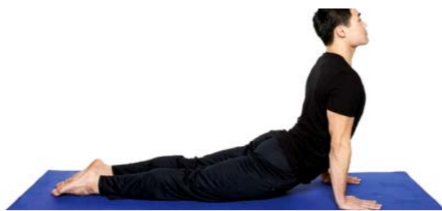
Gambar 4.3 Gerakan Yoga Bhujangasana

bisa mencoba dan melatihnya secara perlahan-lahan sampai tubuh mulai terbiasa. Gaya gerakan Bhujangasana ini memang ampuh untuk mengobati sakit punggung. Dengan melakukan gerakan ini otot perut akan lebih kencang sekaligus akan membakar lemak yang ada dalam perut. Menghilangkan perut buncit dan lemak yang menumpuk tidak harus selalu dengan biaya mahal, menggunakan obat, atau melakukan berbagai olahraga berat. Sekarang Anda dapat mencoba hal baru yang lebih mudah dan yang akan Anda dapatkan juga tidak akan kalah dengan melakukan jogging, aerobic maupun olahraga yang lainnya.