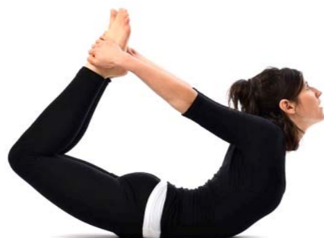
Gambar 4.4. Gerakan Yoga Dhanurasana

ini sangat efektif untuk membakar lemak yang menumpuk di perut, menurunkan berat badan menguatkan otot punggung, dan membuat postur tubuh menjadi lebih terbentuk lagi. Saat melakukan pose, sirkulasi darah akan berkurang dan setelah masa istirahat sirkulasi darah akan mengalir dalam jumlah yang lebih besar. Hal tersebut dapat meningkatkan kelenturan tulang belakang dan menambah