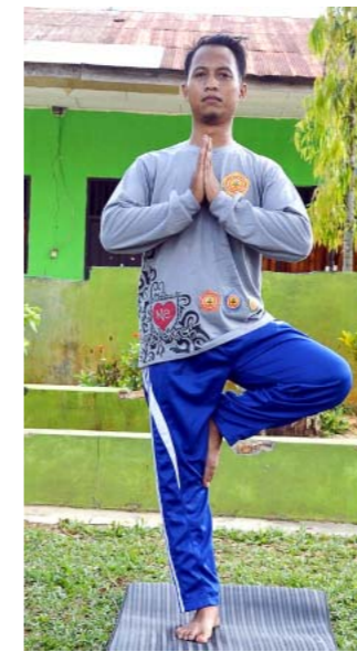
Gambar Gambar 4.8 Gerakan Yoga Vrksasana

Cara melakukan gerakan yoga Uttanpadasana adalah dengan berbaring dan posisi sempurna di atas matras. Lalu luruskan kaki dan tangan lurus disamping tubuh. Kemudian perlahan angkat kaki sampai terbentuk 40 derajat sampai tegak lurus. Langkah selanjutnya cukup menahan posisi tersebut selama satu menit. Lalu turunkan secara perlahan-lahan kembali ke posisi sempurna. Lakukan dan ulangi gerakan yoga Uttanpadasana ini sebanyak 5 sampai 10 kali. Gerakan yoga Uttanpadasana mampu untuk mengencangkan otot kaki dan juga ototperut. Sehingga lemak yang ada pada perut dan paha dapat berkurang. Lakukan secara rutin gerakan yoga Uttanpadasana untuk hasil yang maksimal sampai mendapat bentuk tubuh yang diinginkan.