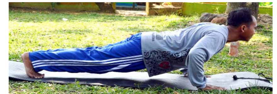
Gambar 4.9. Gerakan Yoga Chaturanga

Gerakan yoga Chaturanga ini berguna untuk mengecilkan perut, dan menurunkan berat badan, selain