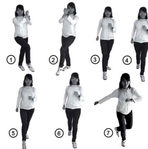
Gambar 4.14 Gerak langkah sajojo

2. Ayunkan kaki kiri ke samping depan kanan diikuti oleh ayunan kedua tangan ke depan sambil bertepuk tangan. Lakukan gerakan ke-1 dan ke-2 ini secara bergantian, masing-masing sebanyak 2 kali.