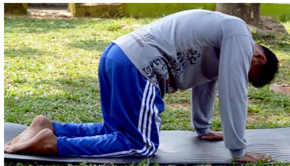
Gambar 4.11 Gerakan Yoga Marjariasana lihat ke bawah