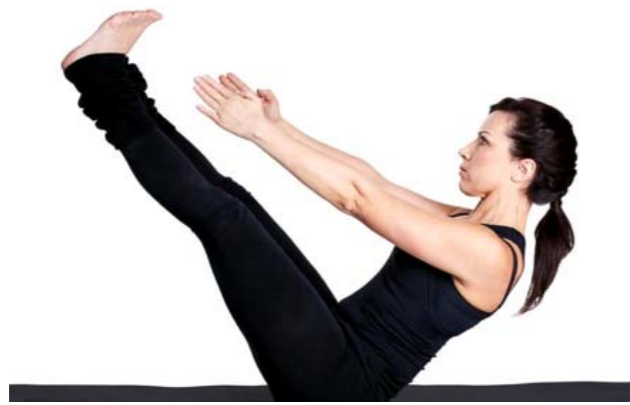
Gambar 4.6. Gerakan Yoga Naukasana

Lalu tahan sampai 30 hingga 60 detik, dan lakukan gerakan ini sebanyak 5 kali. Gerakan yoga Naukasana akan membuat otot perut menjadi lebih kencang dan kuat serta lemak di perut juga akan hilang. Pada akhirnya akan terbentuk perut rata seperti yang diidamkan. Lakukan Gerakan yoga Naukasana dengan rutin untuk mendapatkan hasil terbaik dan pastinya perut buncit tidak akan kembali lagi.